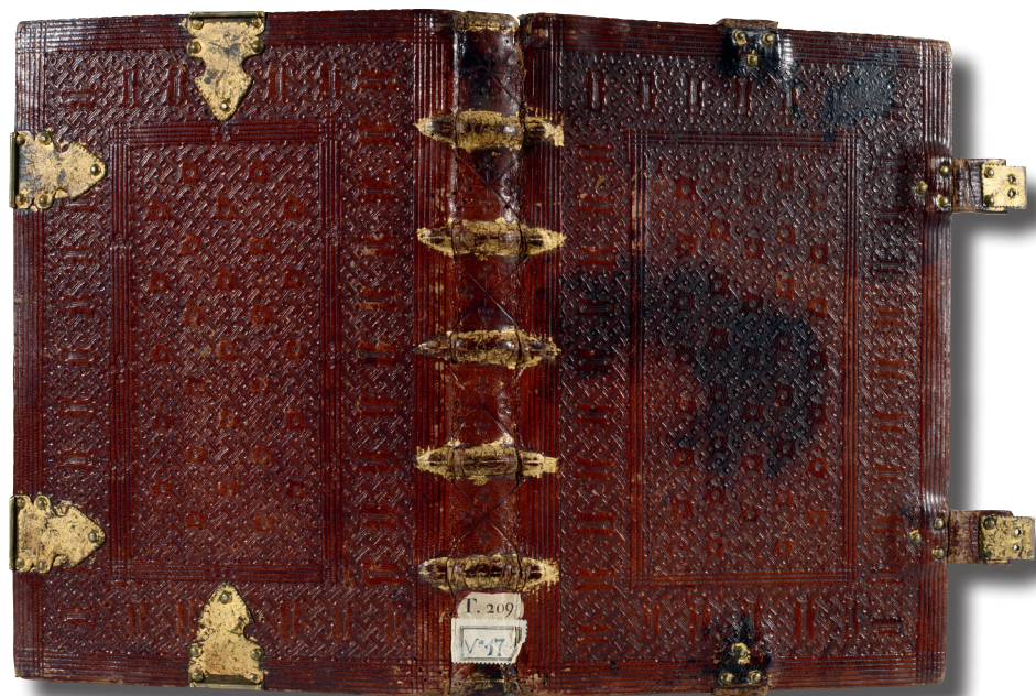
Encuadernación mudéjar de bandas rectangulares (siglo xv) que contiene las Introducciones latinae de Antonio de Nebrija. (Cat. 19)

Los artesanos mudéjares encontraron en las cubiertas de los libros un soporte ideal para desplegar todo su repertorio de geometrías, complejas lacerías y claroscuros. Además, supieron adaptarse a las nuevas exigencias del libro impreso, sustituyendo materiales y mejorando las técnicas, facilitando así la transición de la encuadernación medieval a las técnicas modernas.