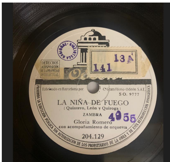
Manuel López-Quiroga, La niña de fuego: zambra . Barcelona, Compañía del Gramófono Odeon, 1946 Biblioteca Nacional de España DS/141/13