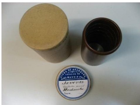
El Mochuelo Javeras. Madrid, Viuda de Aramburo (entre 1897 y 1900). Biblioteca Nacional de España CL/142

Desde su nacimiento hasta su debut teatral tras la guerra civil, del 23 al 38 encontramos las raíces artísticas de Lola Flores. Entre taberna y taberna, tablao y tablao, también para la jerezana son los años de la Edad de Plata, donde se produce la brillante recuperación flamenca de la España de los años veinte de la mano de figuras como Manuel de Falla, los hermanos Manuel y Antonio Machado, los también hermanos Serafín y Joaquín Álvarez Quintero, Federico García Lorca, las artistas La Argentina, La Argentinita o Pastora Imperio, cuyo testigo inconscientemente recoge la jerezana del Barrio de San Miguel. Son las décadas de la copla Ojos verdes.