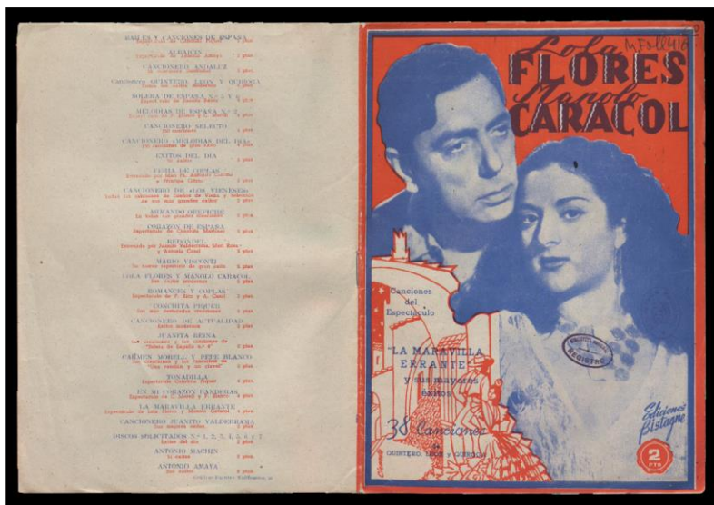
Cancionero del espectáculo «La maravilla errante» y sus mayores éxitos. Ediciones Bistagne, aproximadamente en 1950. Biblioteca Nacional de España M Foll/ 416/20

Ficción y realidad se entremezclaban en un juego cómplice de interrelaciones —de la ficción a la realidad y de la realidad a la ficción— que no hacían sino aumentar el éxito artístico y social de la pareja, que vivía aquella relación de teatro también fuera de la escena con una intensidad bastante desbordada y escandalosa, sin ningún tipo de pudor. Toda una paradoja en una sociedad tan marcada por una moral sexual oficial basada en el «bendito atraso», «el legado de José Antonio» y la «pared de cal y canto».