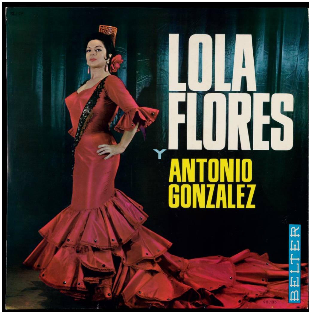
Lola Flores y Antonio González. Barcelona, Ediciones Belter, 1967 Disco de vinilo (33 rpm). Biblioteca Nacional de España DS/2036/1