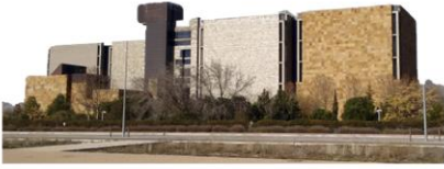
Sede de Alcalá de Henares M-121 Crta. de Meco km. 1,6 Avda. Punto Es s/n