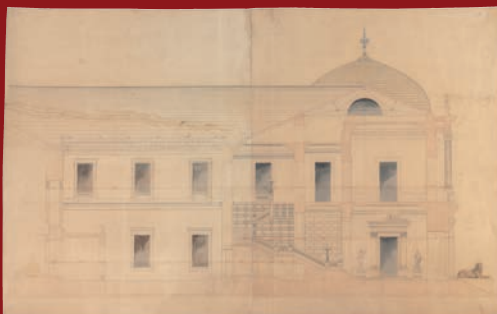
Sección por el vestíbulo del Museo Arqueológico, A. Ruiz de Salces.

La arquitectura del hierro y la Biblioteca Nacional por Pedro Navascués Palacio (Real Academia de Bellas Artes de San Fernando).