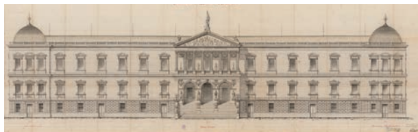
Fachada de Recoletos, A. Ruiz de Salces. MECD.AGA.

D E pasadizo a palacio. Las casas de la Biblioteca Nacional explica la historia de los edificios en los que ha estado alojada la que es hoy Biblioteca Nacional de España, desde su apertura en 1712 hasta su definitiva instalación en el palacio de Recoletos, donde abre sus puertas en 1896.