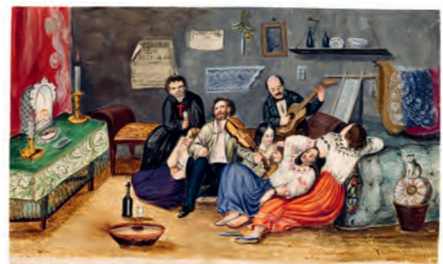
Juan Agustín Guerrero (atrib.) Misa del niño , (s/f) Del Álbum de costumbres ecuatorianas. Paisajes, tipos y costumbres Acuarela, pastel, tinta y lápiz sobre papel Biblioteca Nacional de España