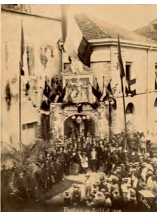
F. Blanc Centenario de la Revolución Francesa (Panamá, 14 de julio de 1889) Albúmina sobre papel

alternativos. Dictadores, militares o civiles, gobernaron de forma totalitaria defendiendo planes conservadores en algunas ocasiones o programas de desarrollo modernizante en otros. Políticas económicas de crecimiento hacia dentro y hacia fuera se sucedieron mientras la población ascendía exponencialmente, a la pobreza se expandía, la emigración se incrementaba, la dependencia respecto al exterior se ampliaba y el intervencionismo de las altas potencias se vigorizaba. Los desequilibrios fiscales se sucedieron y las ideologías alimentaron a las distintas opciones políticas, a la vez que los populismos se enraizaron. Tras la crisis de la deuda en la década de 1980, se generalizaron las formas democráticas de elección de los gobernantes.