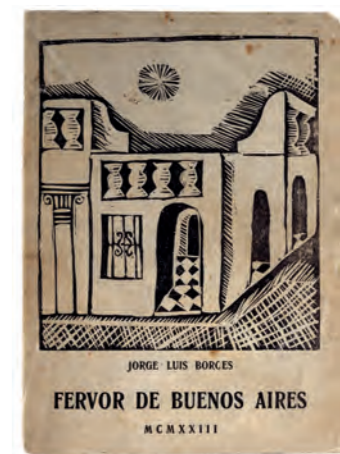
Jorge Luis Borges Fervor de Buenos Aires Buenos Aires, s.d., 1923 Biblioteca Nacional de España