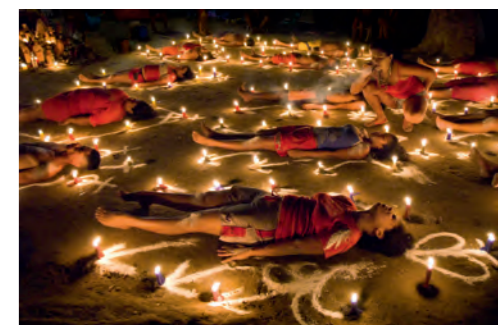
Cristina García Rodero Velación colectiva, Venezuela , 2006 De la serie La Diosa de los ojos de agua (María Lionza) Impresión lambda Colección CA2M. Centro de Arte Dos de Mayo. Comunidad de Madrid