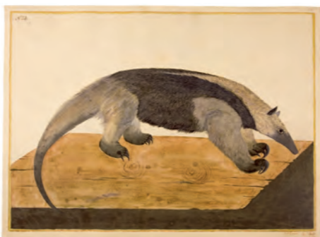
José Cardero Cuadrúpedo , c.1790 Tinta y aguada sobre papel Museo Naval de Madrid

El espíritu ilustrado de la razón, discutido en las Sociedades Patrióticas y divulgado a través de publicaciones, impulsó durante el siglo XVIII transformaciones en la organización de la economía, la gestión de la política, el ordenamiento de la sociedad y la concepción de la naturaleza. Proyectos, reglamentos, censos y clasificaciones ayudaron a reordenar las realidades americanas. Científicos, artistas, exploradores, comerciantes y administradores públicos fueron mostrando distintas caras del continente, abriendo paso a la labor que, en la plástica y la literatura, desarrollarían décadas después los viajeros del romanticismo.