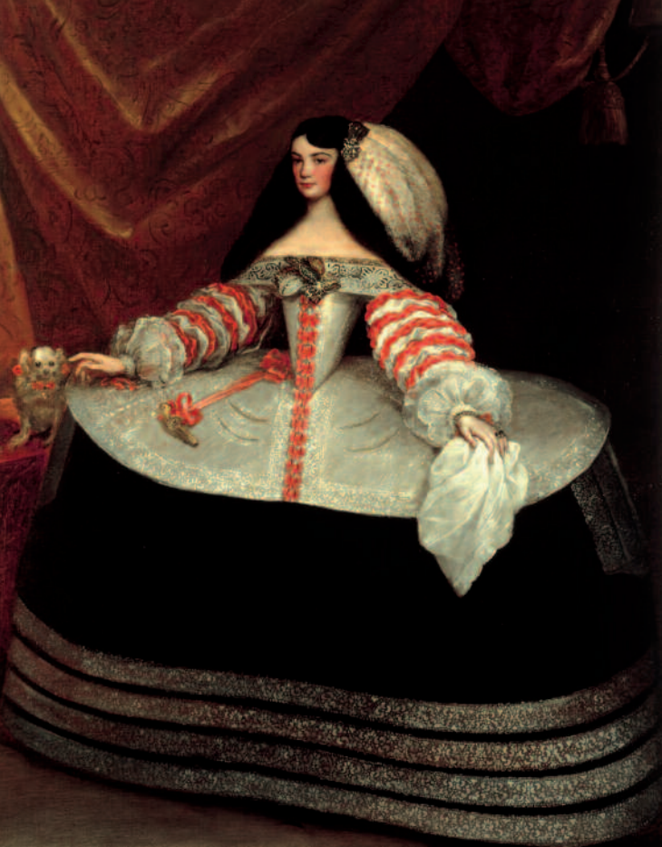
JUAN CARREÑO DE MIRANDA Retrato de Doña Inés de Zúñiga, condesa de Monterrey, 1660-1670 Óleo sobre lienzo